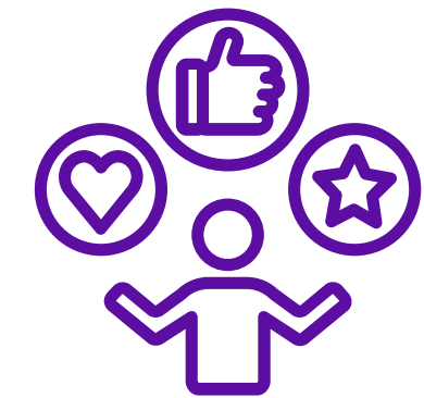
Maatwerk en co-creatie